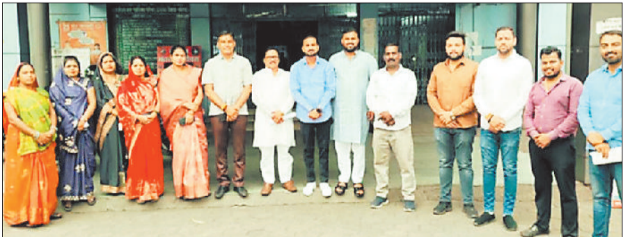
नींदा प्रस्ताव पारित करने के बाद उपस्थित पार्षद।

नगर पालिका परिषद दीपका में सोमवार की दोपहर 3 बजे सामान्य सभा की विशेष बैठक आयोजित की गई। बैठक में संविधान के 131वें संशोधन से संबंधित नारी शक्ति अधिनियम 2023 (महिला आरक्षण विधेयक) पर चर्चा की गई। बैठक में बताया गया कि यह विधेयक जो देश की आधी आबादी को राजनीतिक प्रतिनिधित्व देने और महिलाओं को लोकतंत्र में सशक्त बनाने की दिशा में एक ऐतिहासिक कदम था, विपक्ष की सहमति के अभाव में संसद में पारित नहीं हो सका। इसे लेकर नगर