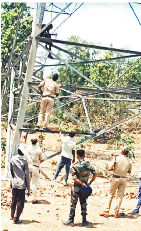
युवक को टॉवर से नीचे उतारने चढ़े पुलिस कर्मी।