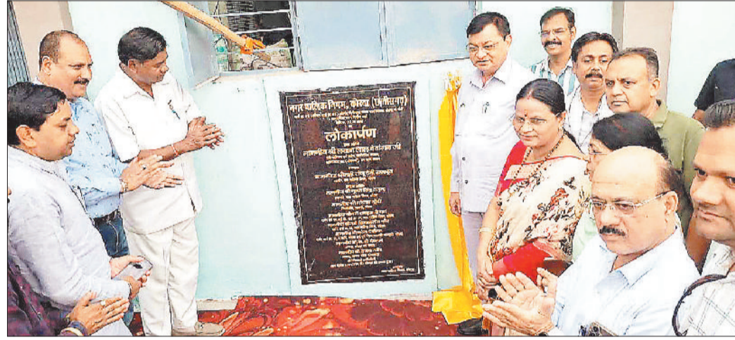
भवन का लोकार्पण करते उद्योग मंत्री, महापौर एवं अन्य।