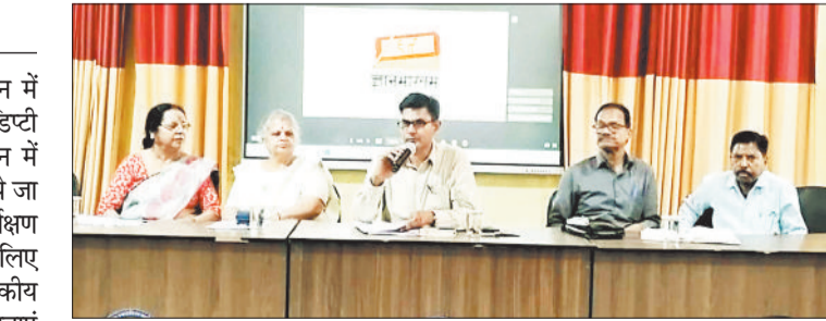
बैठक को संबोधित करते हुए अभियान के नोडल अधिकारी व उपस्थित प्रचार्य व प्राध्यापक।